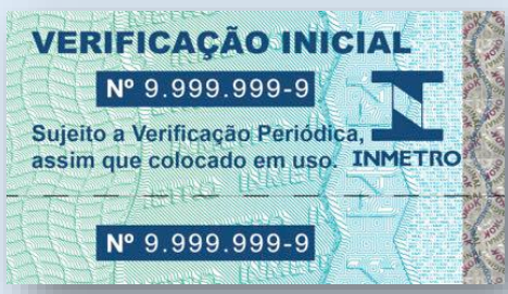
Marca / Selo de verificação inicial (Inmetro).

Marca / Selo de verificação inicial (Equipamentos eletrônicos e mecânicos)