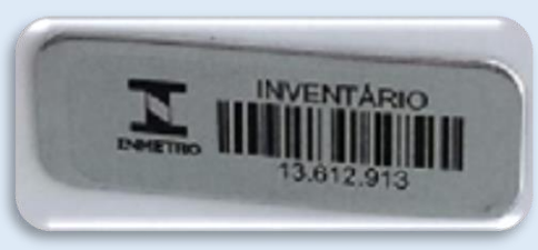
Marca de inventário (Inmetro).